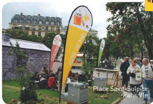
Place Saint-Sulpice Paris VIe