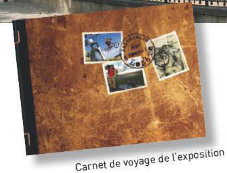
Carnet de voyage de l'exposition