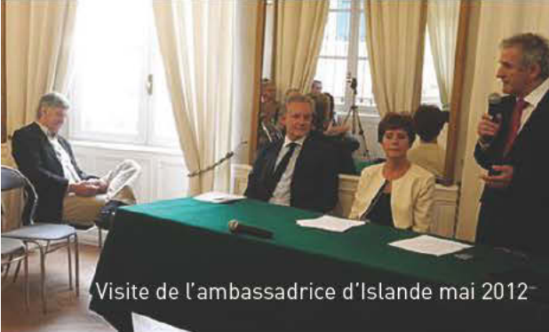
Visite de l'ambassadrice d'Islande mai 2012