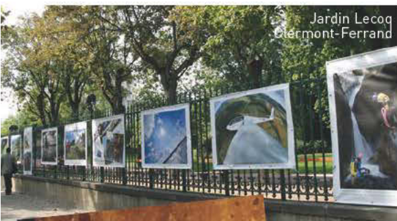
Jardin Lecoq Clermont-Ferrand